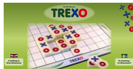
Fem i rad med fler dimensioner.