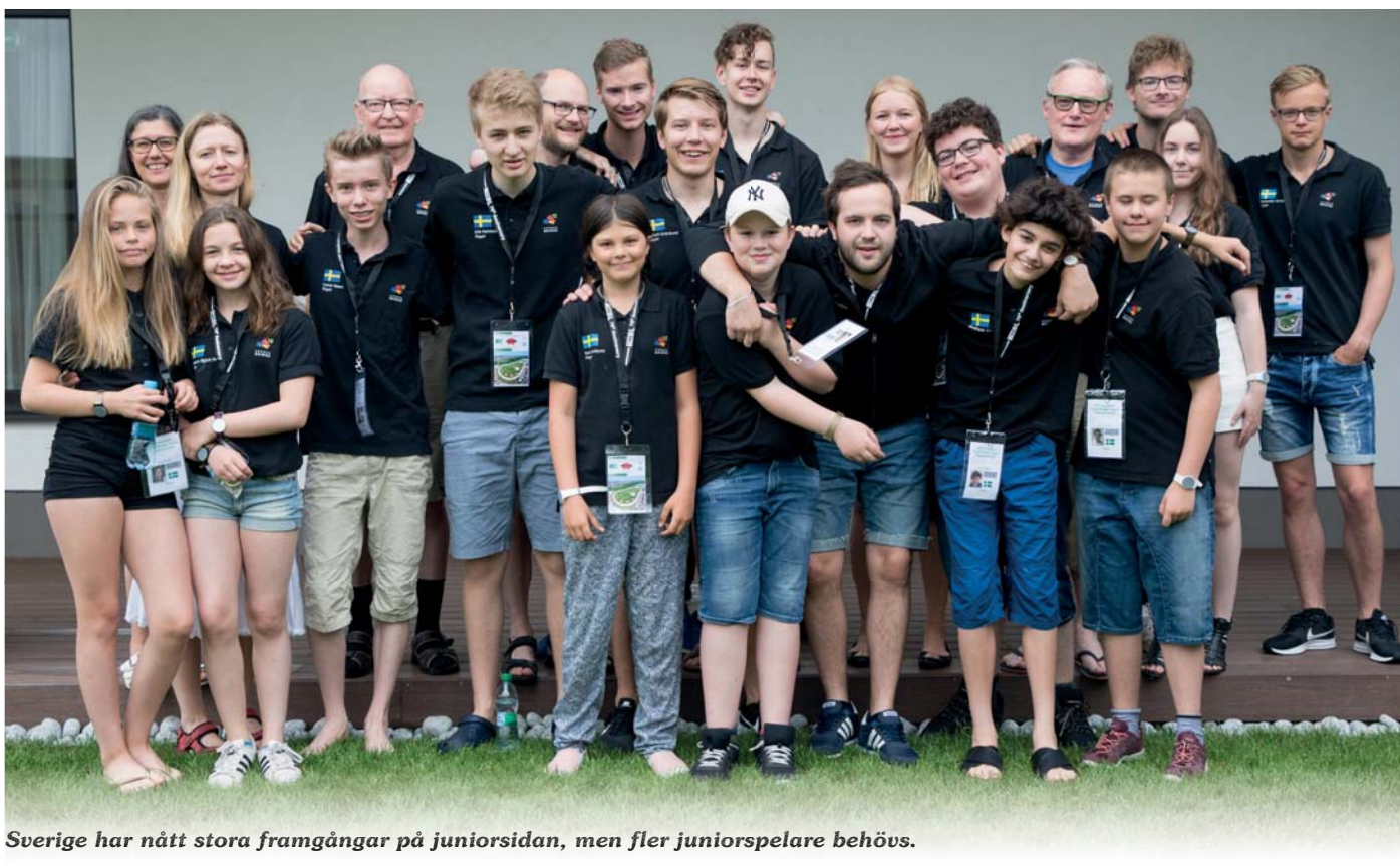
Sverige har nått stora framgångar på juniorsidan, men fler juniorspelare behövs.

– Vi har tagit kontakt med ett par mellanstadieskolor, berättar hon.