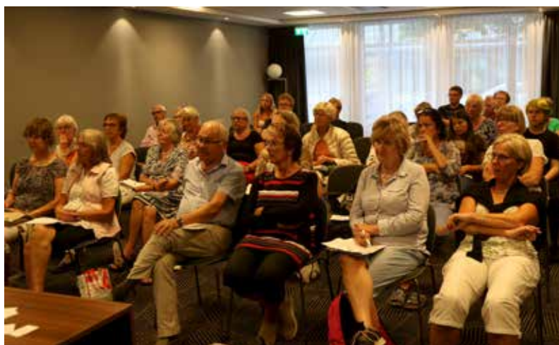
Bridgefestivalen erbjuder fem kostnadsfria seminarier.

Det var fullsatt när det första seminariet av totalt fem genomfördes på söndagskvällen.