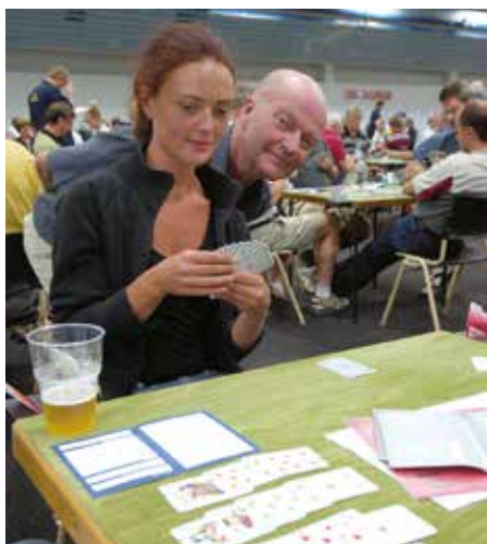
Bakblåsare i Jönköping.

Mässhallen i Jönköping, där Bridgefestivalen arrangerades 2005-2007.