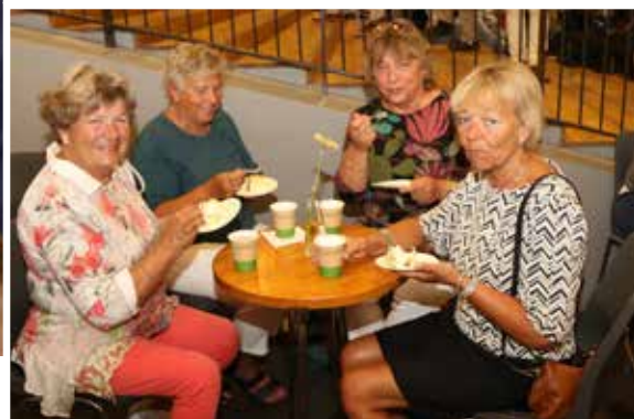
Örebro kl 11.30 jubileumstisdagen den 30 juli 2019. Festivaltoppar bjuder på tårta för att fira den 25:e festivalen.