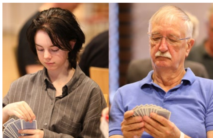
Text och bild: Thomas Wedin

– Det har varit en rolig upplevelse, menar de även om de slutade med bara tre par bakom sig i resultatlistan.