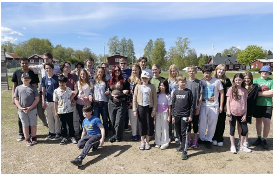
Några ungdomar som deltog i lägret Backamo i våras.

– Då är vi en bit på väg, men de måste tycka det är kul också.