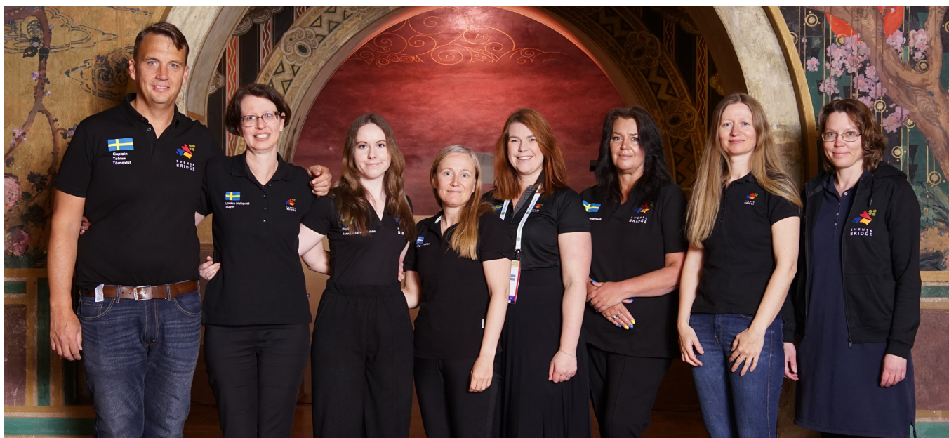
Sverige - vann VM Guld igen, april 2022 i Salsomaggiore, Italien

Sverige har under de senaste tjugo åren noterat otaliga framgångar på damsidan vid Internationella tävlingar. För ett litet tag sedan kom en inbjudan från EBL om att årets upplaga av Champions Cup som traditionellt spelas i november månad, inte bara ska spelas för öppna lag, utan nu också med en damklass. Så bilda lag med dina bridgekompisar, ta chansen att få äran att spela för Sverige!