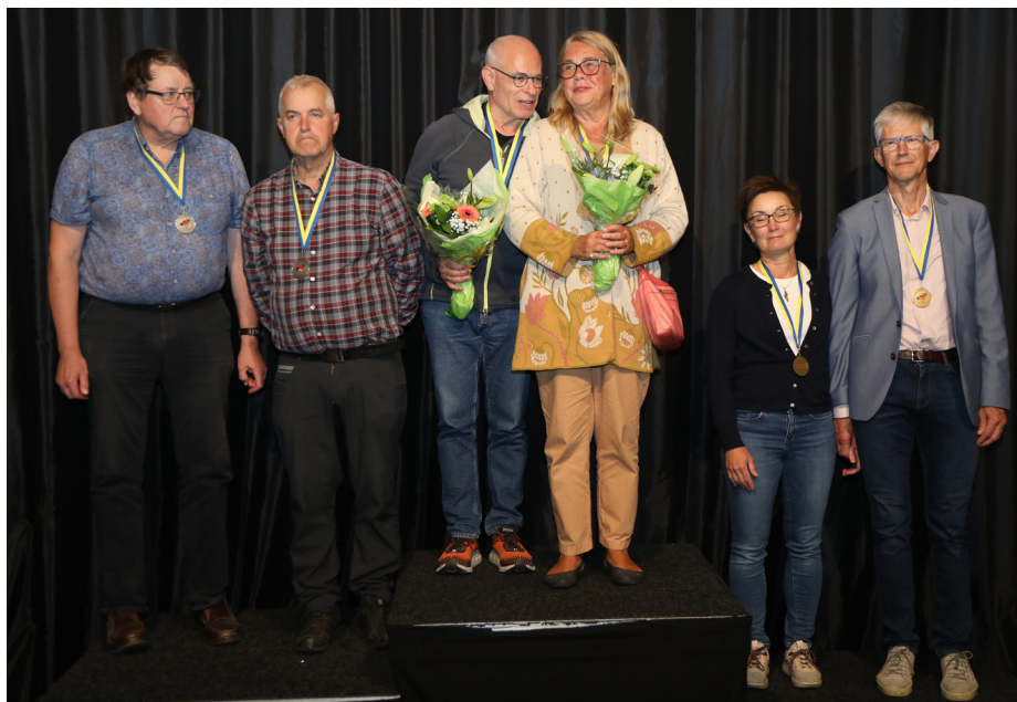
Pallen i nya SM klassen 30 HCP+

– I första rundan låg vi långt ner, men vi ledde efter första dagen. I morse gick det halvbra. Vi låg fyra ett tag innan vi kravlade oss upp i topp, säger de.