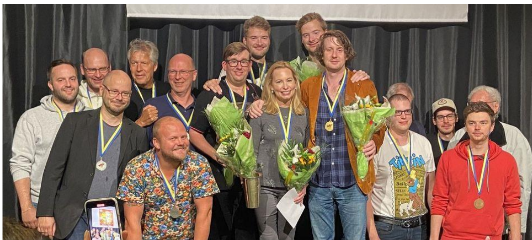
1a Dinner club, 2a Två med lite hår, 3a Karlssons frestelse

Av ovanstående lag var det bara "lite av varje" som klarade sig kvar riktigt länge och slutade på en fin delad 5te plats!