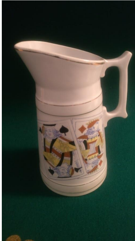
Rörstrand mjölkkanne, ca 1930-40 Fyndat på Erikshjälpen för 35 Kr 😊