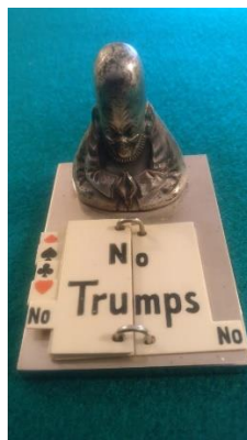
Äldre trumfindikator som användes bl a i Whist

En mer perfekt hand för att öppna med det här budet får man leta efter