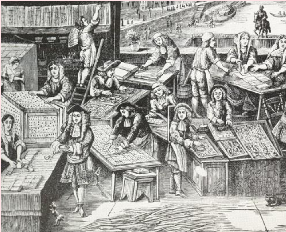
Tillverkning av spelkort i Paris omkring 1680

Det är inte bara Öbergs som har tillverkat spelkort här i Sverige – även om de klassiska Öbergskorten sedan 1999 numera trycks i Belgien av ekonomiska skäl. Faktum är att vi under årens lopp har haft över 200 spelkortstillverkare i landet; av alla dessa finns nu bara en enda kvar, Offason i Skåne.